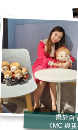
攝於自家應援活動 《MC 與我有關生日會》