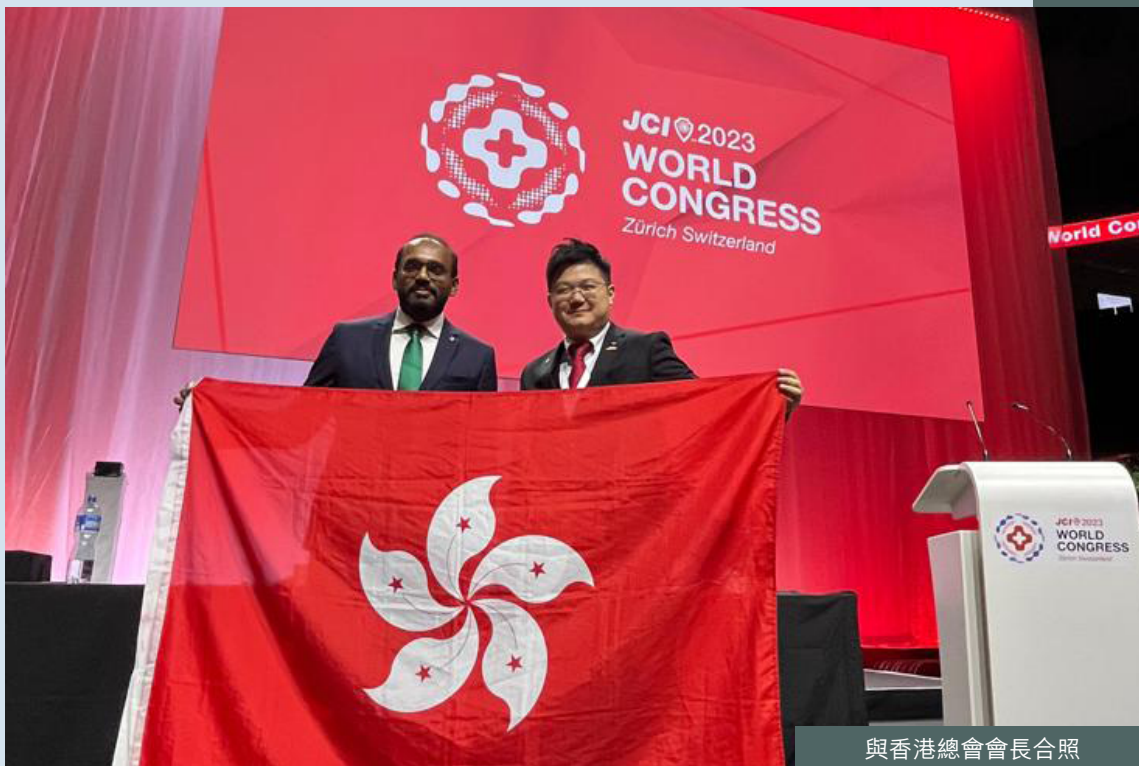
與香港總會會長合照

為了促進創造年輕領導者，我建議保持終身學習並保持適應力。專注於建立強大的網絡，不要害怕承擔經過計算的風險。請記住，領導力不僅僅是領導他人，還包括激勵他們推動積極正面的改變。培養您的團隊，傾聽不同的觀點，並以身作則，發揮作用。 To empower young leaders, I advise embracing lifelong learning and staying adaptable. Focus on building a strong network and don't be afraid to take calculated risks. Remember, leadership is not just about leading others but also about inspiring them to drive positive change. Nurture your teams, listen to diverse perspectives, and lead by example to make a difference.