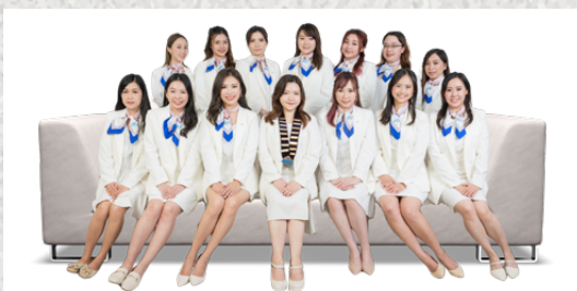
2024 年本會董事局成員