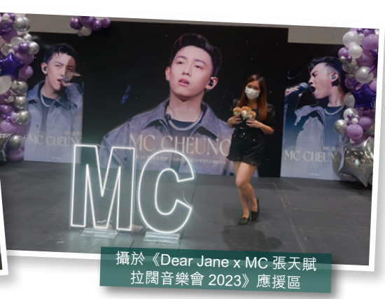
攝於《Dear Jane x MC 張天賦 拉闊音樂會 2023》應援區

撰文及照片來源：石芷澄 出版事務董事 @as1498.mc (Stefany Shek)