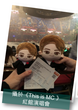
攝於《This is MC》 紅館演唱會

態度決定高度，取決於你對一件事的熱情，MC 張天賦正正就是一個好的例子，賦二代就是正正了解過他背後的故事，喜歡他態度才成為「死忠」，他並非天生唱歌動聽，他的能力是後天一朝一夕練成，由街頭表演到成為明星，所以他是值得擁有現在的一切。同時，亦都想勉勵讀者們，勇敢去追夢。