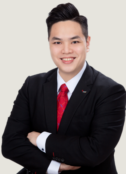
總會指派執行委員的話

優雅、活力、認真、細心，這些都是城市女青年商會帶給我的感覺，本人十分榮幸獲委派為二零二四年城市女青年商會的總會指派執行委員。